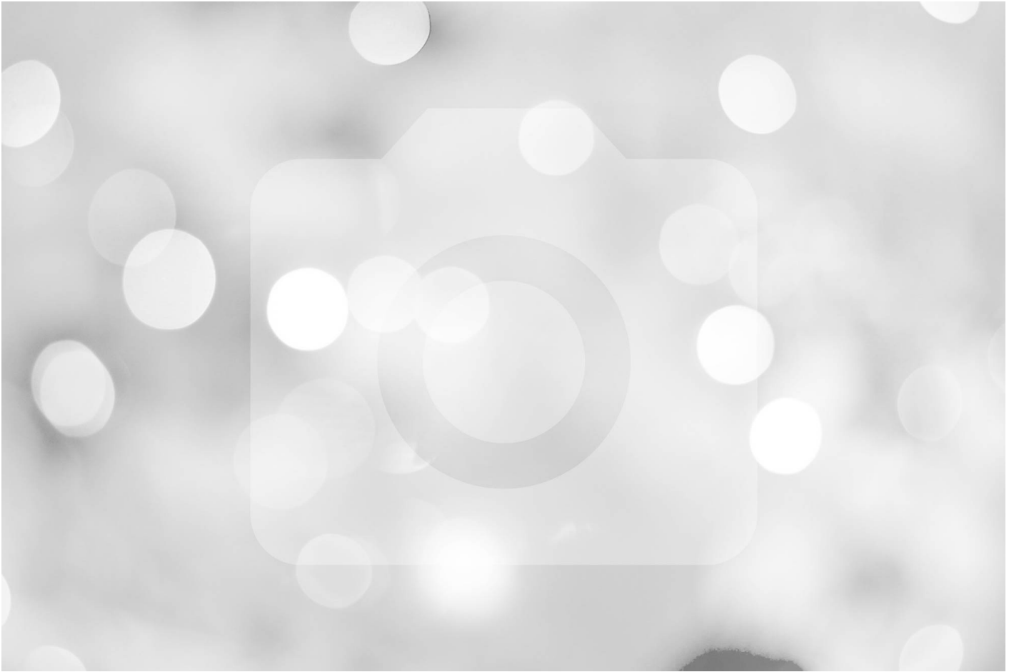
Les Grands Taillis 38680 Saint-André-en-Royans