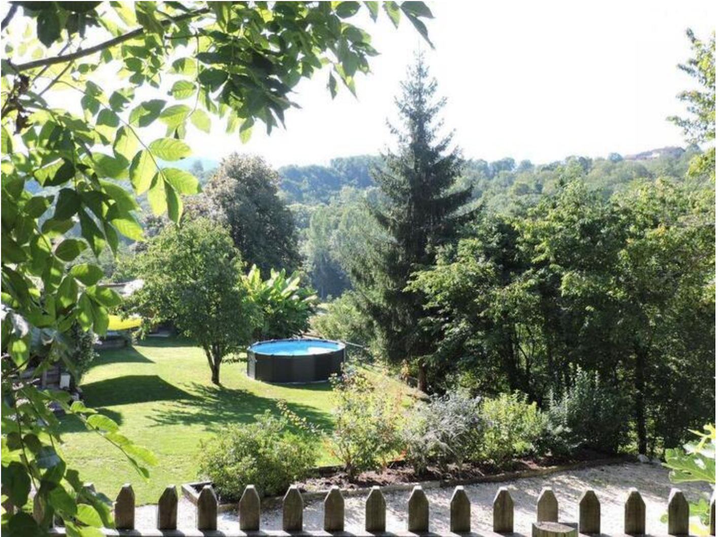
Gîte des Blanchons