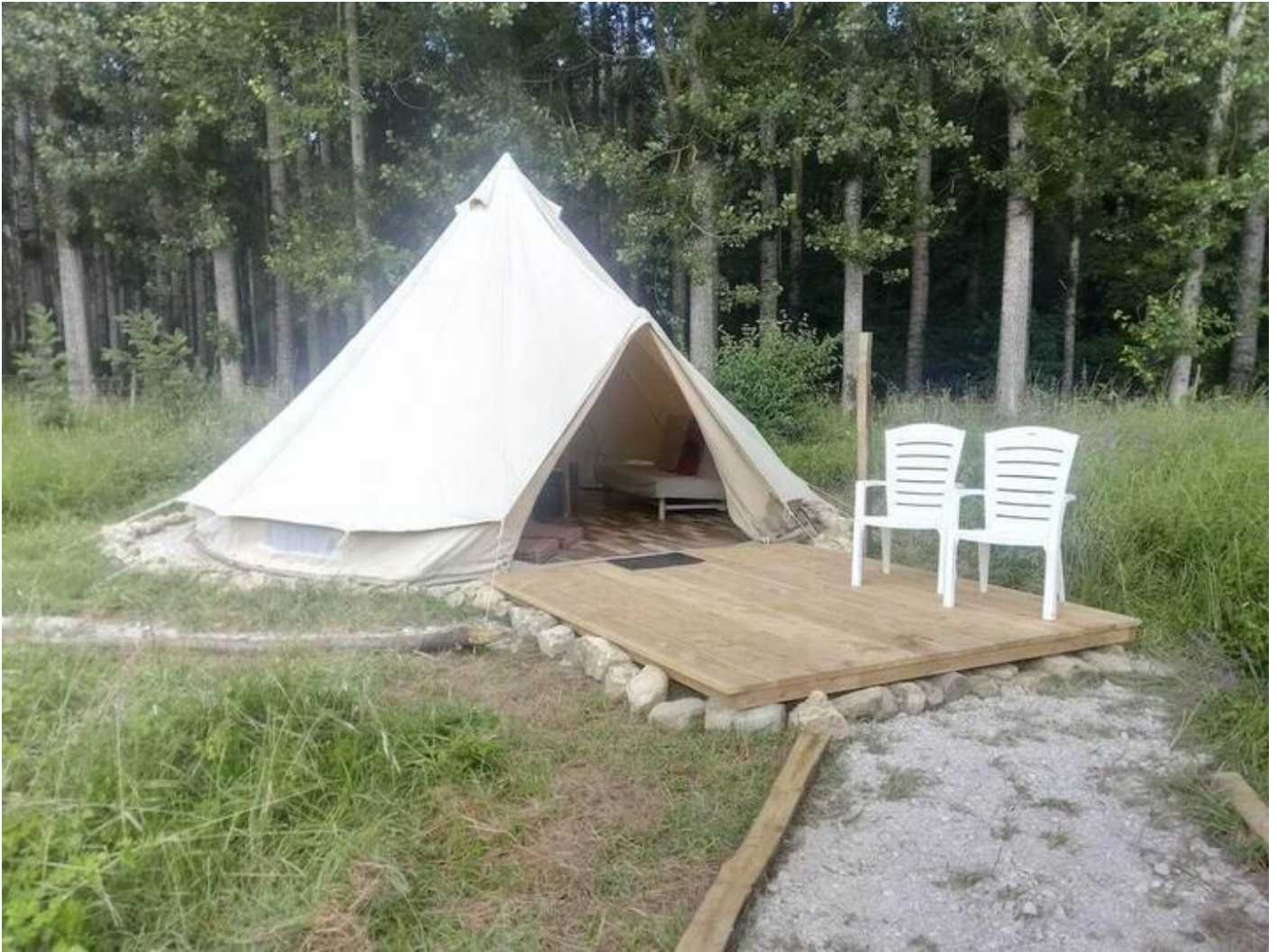
Les Gîtes du Moulin | La Tente Sibley 38680 Saint-André-en-Royans

Elle dispose de toilettes sèches extérieures, d'une terrasse et d'un coin feu. La tente est équipée d'un coin cuisine, d'un canapé-lit, d'un lit double et d'une table basse. Une table avec des chaises est mise à votre disposition sur la terrasse. Le tente ne possède pas de salle de bains, vous pourrez cependant faire une toilette de chat avec le jerrican d'eau.