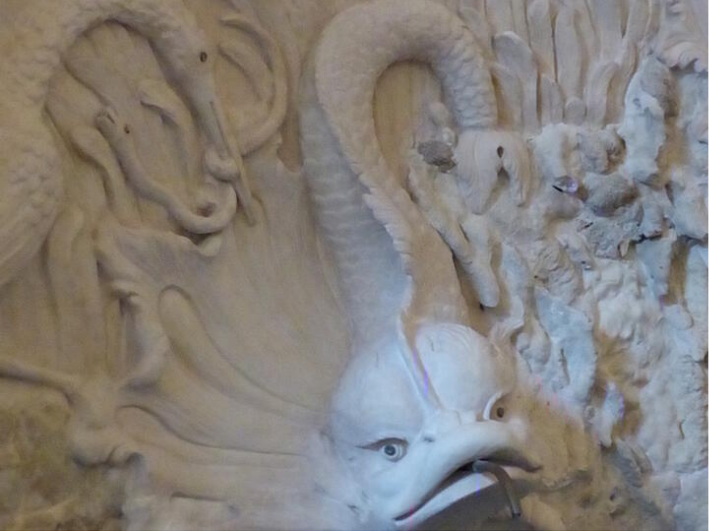
Visite guidée Saint-Antoine au fil du temps - Le temps de la curiosité : curiosités minérales ou a 38160 Saint-Antoine-l'Abbaye

Visite permettant de découvrir des espaces qui ne sont pas ouverts au public.